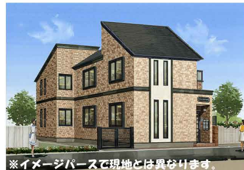
※イメージパースで現地とは異なります。