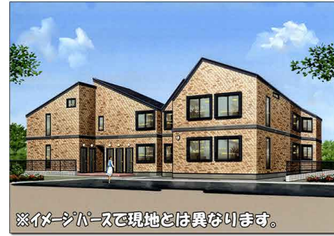
※イメージパースで現地とは異なります。